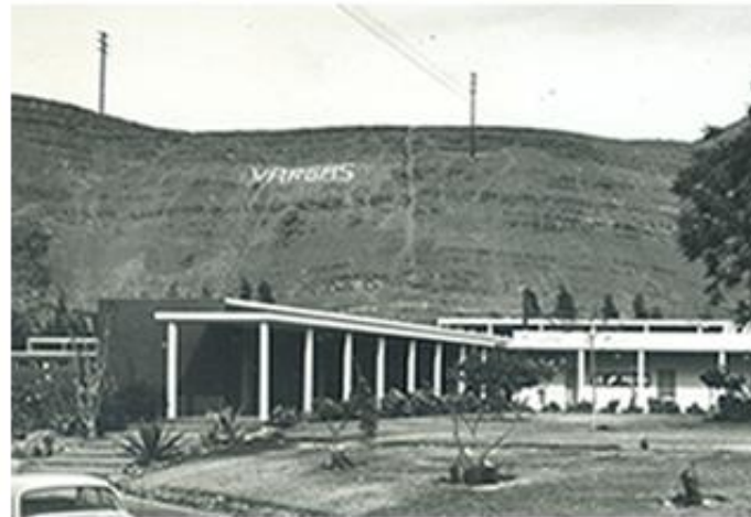
Los primeros grupos de estudio de la UNI